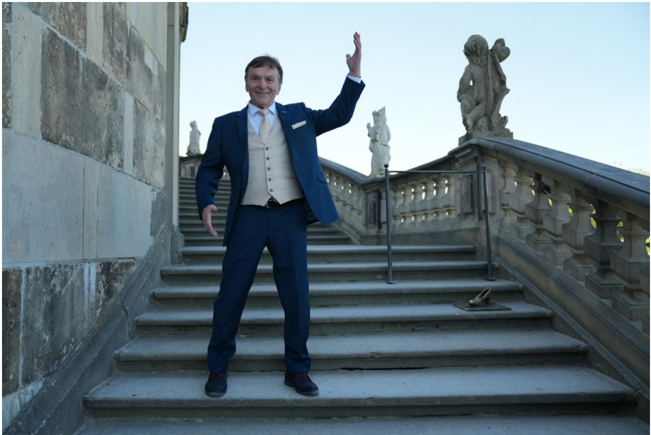
Foto: Dreh mit Schauspieler Pavel Trávniček am Schloss Moritzburg

Strahlender Himmel über Schloss Moritzburg – und ein ganz besonderer Moment nicht nur für Film- und Märchenfans: Der tschechische Schauspieler Pavel Trávniček, bekannt als Prinz aus dem Kultfilm „Drei Haselnüsse für Aschenbrödel“ aus dem Jahr 1973, ist an den Originaldrehort in Sachsen zurückgekehrt. Nach einer Herz-OP Anfang dieses Jahres stand der 75-jährige jetzt erstmals wieder vor der Kamera.