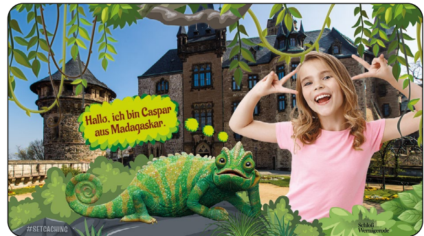
Auf der Fototour kann man sich zum Beispiel mit Caspar in Szene setzen.

Screendesign © Set-Jetting mit Bildmotiven aus „Die Schule der magischen Tiere 2“ © Kordes & Kordes Film Süd GmbH / LEONINE Licensing GmbH / Lightburst Pictures